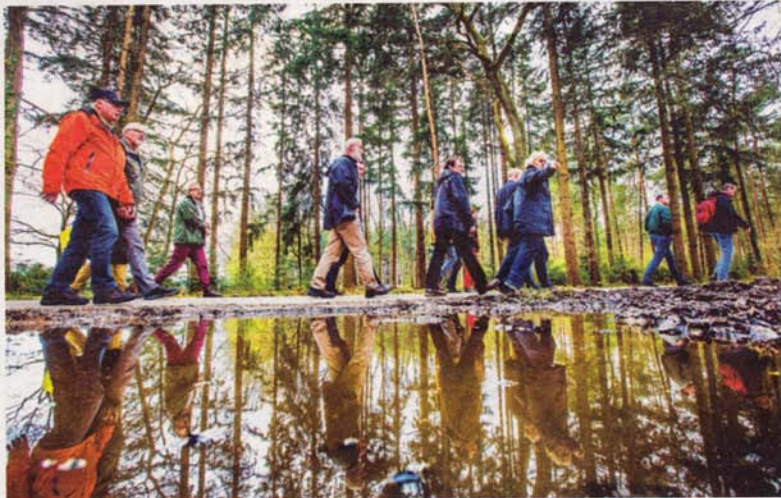
• Het Engelderholt, thans natuurgebied maar vroeger een gebied waar verraders werden opgehangen en gespuis dat ontucht bedreef voorgoed in de moddersloot verdween.

van de Finnmarken. Mieke van Tergouw van Riant: „Het was het laatste stukje van het ss Finnmarken dat ontbrak en dat het scheepvaartmuseum van Stokmarken in Noorwegen dolgraag wilde hebben om het oude schip daar in ere te kunnen herstellen. In oktober 2003 ging de overnachtingsaccommodatie van Riant via Harderwijk en Amsterdam op transport naar Noorwegen en Van Tergouw bouwde op de open plek in Beekbergen naderhand een verblijfsaccommodatie in steen.