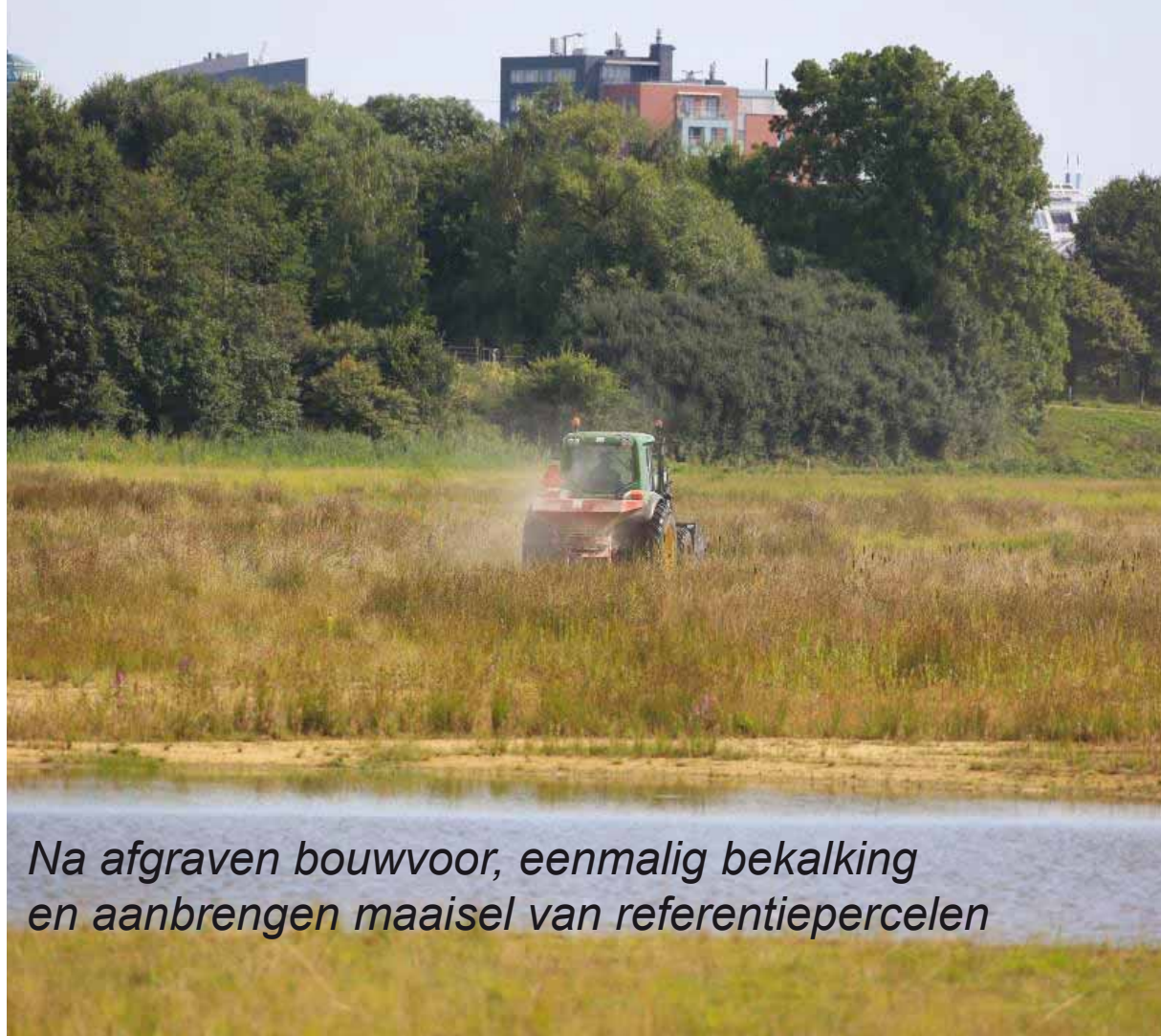
Na afgraven bouwvoor, eenmalig bekalking en aanbrengen maaisel van referentiepercelen

Geschikt maaisel schaars aanwezig, zoveel als mogelijk benutten, thans Moerputten en Labbegat, beide SBB