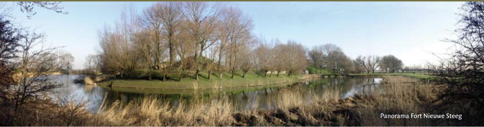
Panorama Fort Nieuwe Steeg