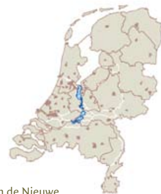
Positie van de Nieuwe Hollandse Waterlinie in Nederland (Bron: C.M. Steenberg en J. van der Zwart - Strategisch Laagland, Digitale Atlas Nieuwe Hollandse Waterlinie - TU Delft, 2006).

— Martijn Boosten en Patrick Jansen, Probos