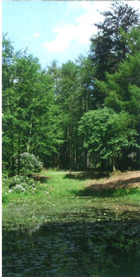
Vrijgestelde leemkuil in Tongeren.

De provincie Gelderland wil de rijke cultuurhistorie van de Veluwse bossen voor het voetlicht brengen. Dit doet zij door het stimuleren van uitvoeringsprojecten waarbij historische elementen of structuren in het bos worden behouden, geaccentueerd, gerestaureerd of gereconstrueerd, of waarbij op een andere wijze de historie van het bosgebied tastbaar en beleefbaar wordt