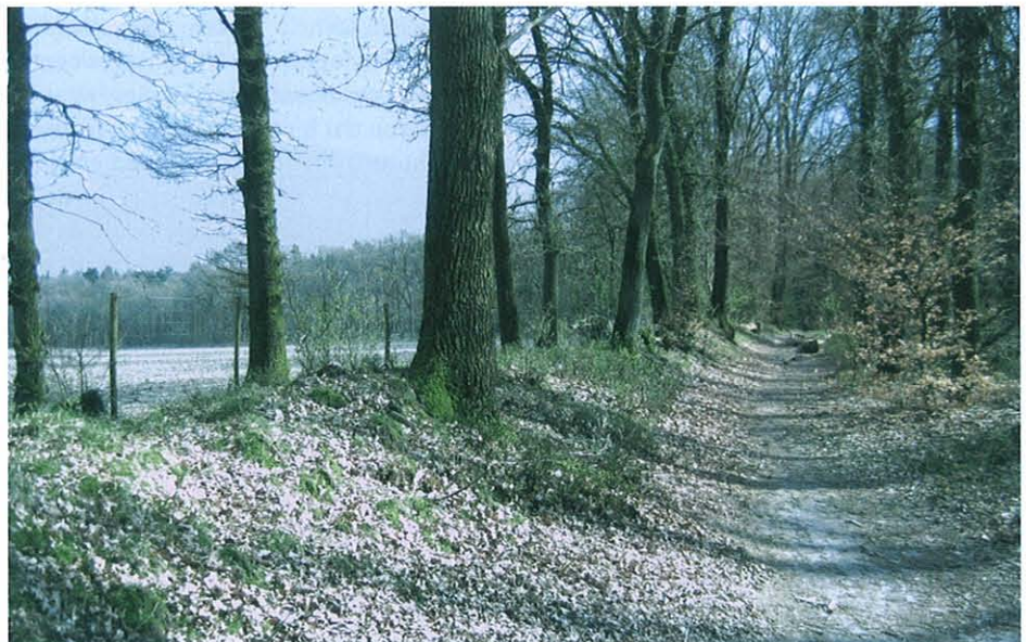
Wal in Van der Huchtbos.

Ir. M. Boosten & Ing. M.H.A. van Benthem Stichting Probos Postbus 253, 6700 AG Wageningen martijn.boosten@probos.nl mark.vanbenthem@probos.nl